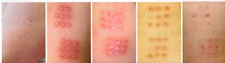
接種直後 接種 4 週 6 週 2 カ月 4 カ月